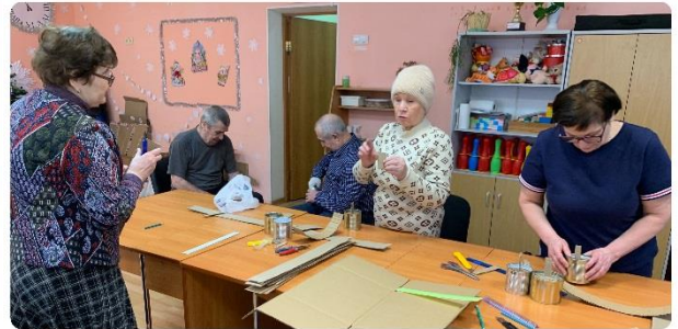
Изготовление окопных свечей