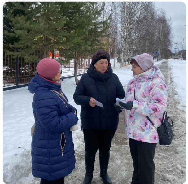
Акция «Узнай о добровольчестве»