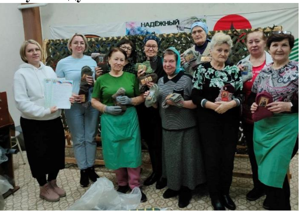
Проект «Теплота югорских сердец»