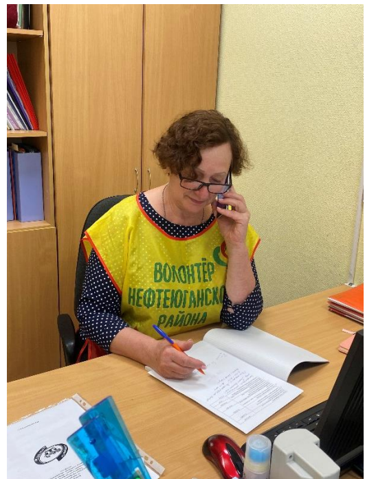
Проект «Компьютерный мобильный WEB-отряд 55+»