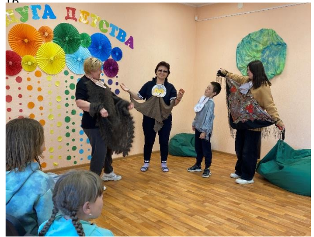
Проект «Бабушкины сказки»