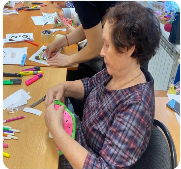
Акция «Мы нужны друг другу»