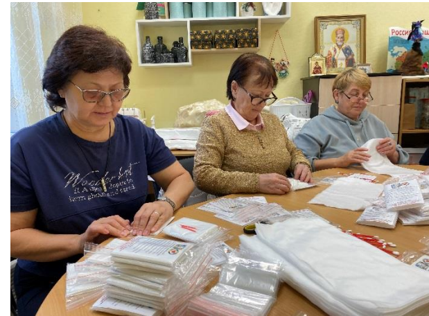
Изготовление сухого душа